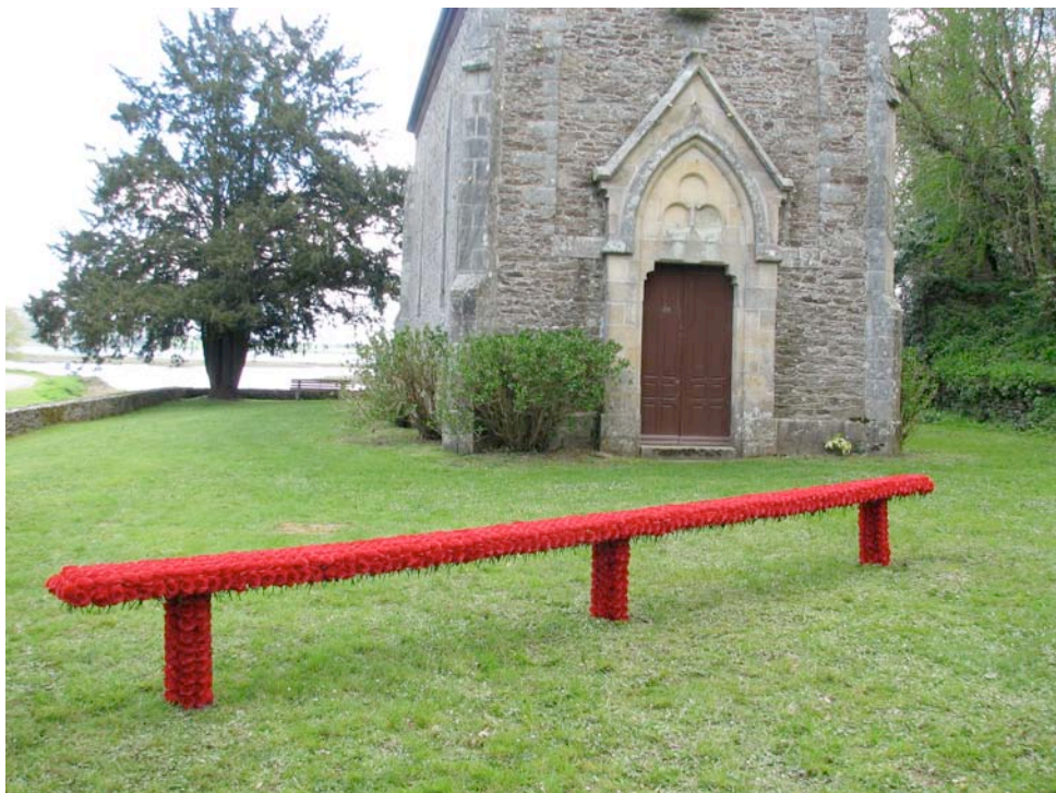
Rencontre , 2013, fleurs artificielles, bois, longueur 6m