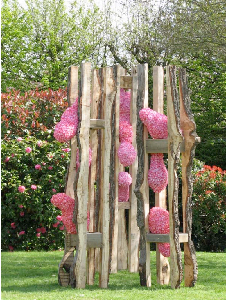
Printemps , 2013, installation 3 sculptures, fleurs artificielles, bois, hauteur 2,20 m